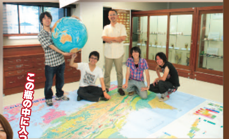
▲床一面に貼られた四国の地質図の上でメンバーたちと。