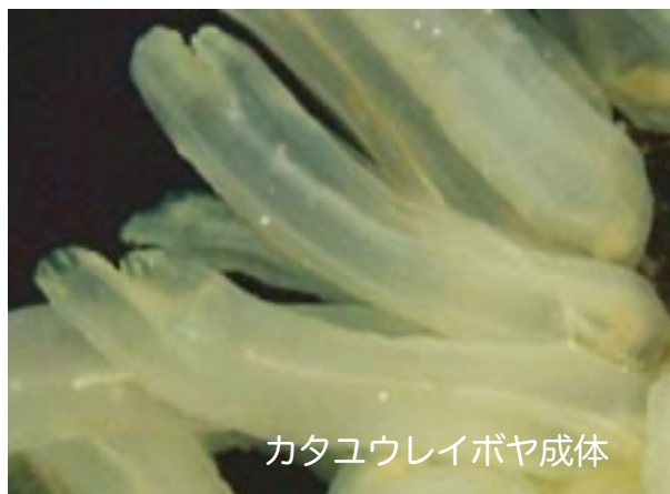
カタユレイボヤ成体

このプログラムでは、ホヤの体をじっくり観察しましょう。血流の方向が周期的に逆転するなど、おもしろい特徴をたくさん見ることができます。私たちと似たところや違うところを探しましょう。ホヤの卵を受精させて、オタマジャクシ型の幼生になるまで、刻々と形を変えるホヤの胚を観察しましょう。きっと生命誕生の神秘を実感することと思います。また、簡単な染色法で、幼生の体内で細胞が分化する様子を見てみましょう。